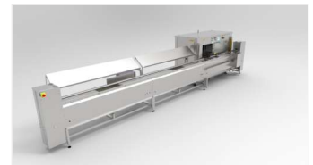
Ensartadora automática SM7000 PLUS con 2 módulos de carga, descensor y elevador