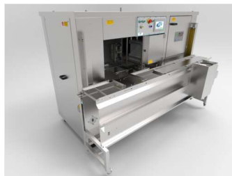
Ensartadora automática SM7000-PLUS

Todas las configuraciones posibles con SM7000