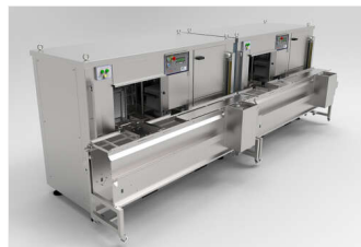
Ensartadora automática doble SM7000-PLUS