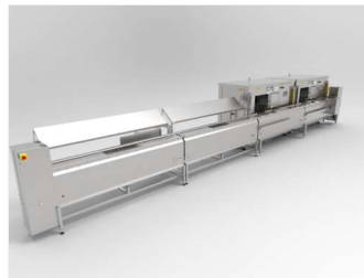
Brocheta automática doble SM7000 PLUS con 2 módulos de carga, descensor y elevador