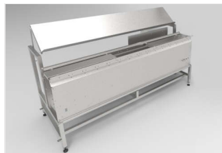
Módulo de carga sin recirculación