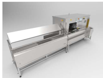
Brocheta automática SM7000 plus con módulo de carga sin recirculación