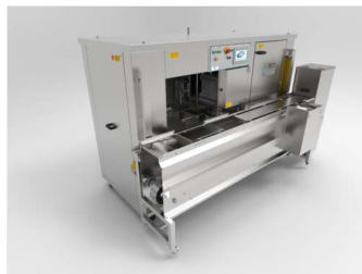
Ensartadora automática SM7000 plus con extractor y descensor con cinta de recirculación