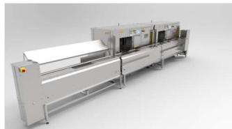
Brocheta automática doble SM7000 plus con módulo de carga, descensor y elevador