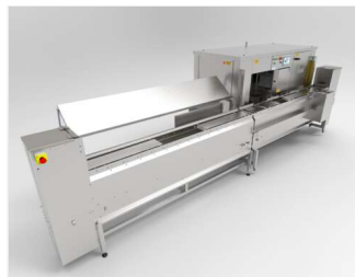
Ensartadora automática SM7000 plus con módulo de carga, descensor y elevador